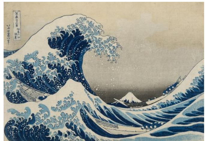
神奈川沖浪裡，選自《富岳三十六景》，1831。彩色木刻版畫，日本。2008,3008.1.JA © 大英博物館理事會。Art Fund協助 Brooke Sewell 贈出資購買

寶爾博物館華人董事長施劉秀枝女士說：葛飾北齋(Katsushika Hokusai)是“千禧年影響世界的一百位名人”中，唯一的一位日本人，他創作的“神奈川沖浪裡”(The Great Wave, 右圖)，幾乎無人不知、無人不曉，甚至可以在世界任何一個角落看到。它是日本浮世繪(Ukiyu-e)藝術的巔峰之作，是世界藝術史上濃墨重彩的一筆，已成為日本國民氣節和文化的象征。